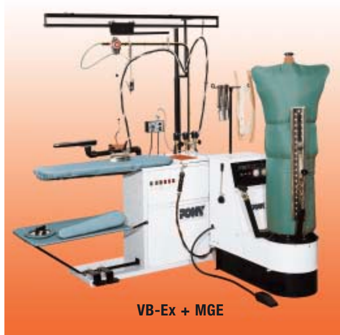
VB-Ex + MGE

Segunda plancha de mano – Brazo con forma planchamangas o con forma de desmanchado – Pistola de vapor o de aire/vapor – Pistola de desmanchar en frío – Nebulizador sobre la empuñadura de la plancha o suspendido.