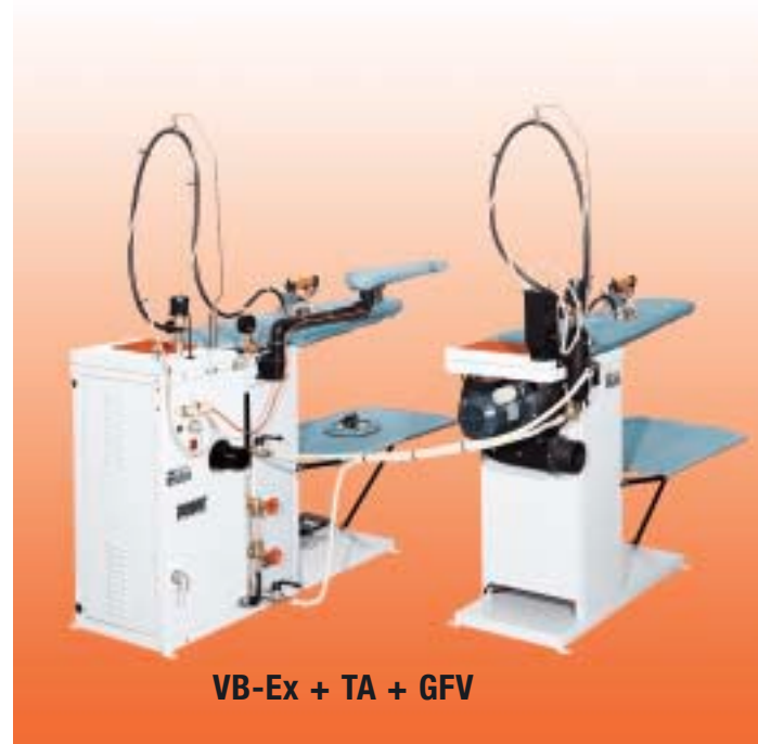
VB-Ex + TA + GFV

Zweiter Dampfbügeleisen, Bügelarm mit Ärmelbügelform und Detachierform, Dampfdetachierpistole oder Dampf-Luftdetachierpistole – Kaldetachierpistole - Wassersprühpistole auf Bügeleisengriff oder mit Haltearm.