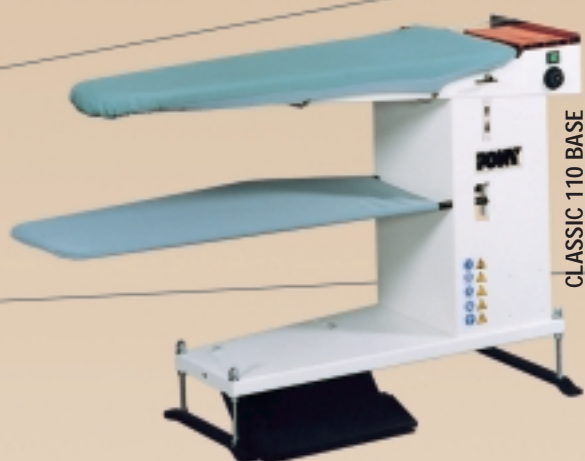
TAVOLA ASPIRANTE REGOLABILE IN ALTEZZA